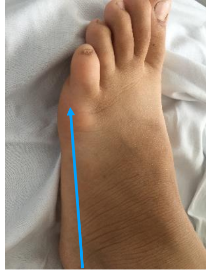
Resim: Isırığın yer

İç anadolu bölgesinde sık görülen Mesobuthus türünün neden olduğu düşünülmüştür. Mesobuthus sokmasıyla otonom hiperstimulasyon, katekolamin salınımı ve kardiyovasküler toksisite görülür(1). Taşikardi, hipertansiyon, midriyazis, hipertermi, hipergelesemi, ajitasyon ve huzursuzluk görülür. Hastamızda hipertermi, ajitasyon, huzursuzluk, taşikardi ve hipertansiyon görülmüştür. Ciddi olgularda katekolamin salgılanması sebebiyle sempatik etkiler daha uzamaktadır. Hastamızda 48. saatte sempatik etkilerin sürdüğü dikkati çekmektedir. Tanıda özellikli test bulunmamaktadır. Antiserum üzerine negatif ve pozitif etkilerin gösterildiği yayınlar mevcuttur (2), (3). Antiserum dolaşımdaki toksini nötralize etme kapasitesine sahip bir antidottur ve temastan hemen sonra uygulanır ise etkinliğinin yüksek olduğu bildirilmiştir (3). Temastan 48 saat sonra antivenom uygulaması ile ilgili literatür bulunmamaktadır. Hastamıza 48 saat sonra verilen antiserum sonrası otonomik bulgular, taşikardi, terleme ve titreme şikayetleri geçmiştir.